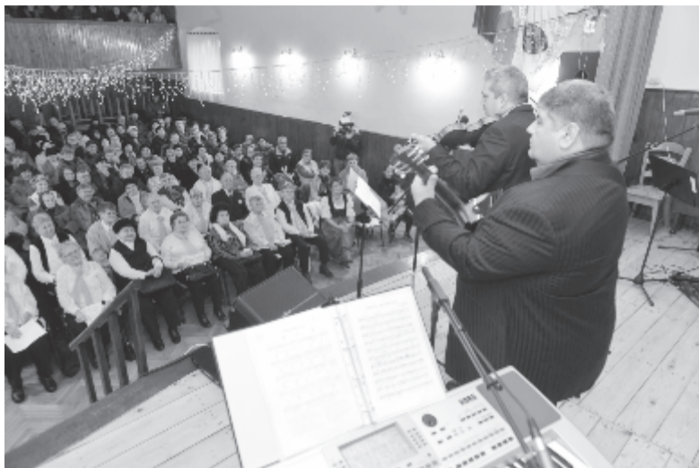
Hegedül a polgármester az időseknek

Marosszentgyörgy Románia kulturális településéhez illő módon készül Jézus születésének ünnepére. A múlt héten a több száz gyereket magába foglaló Kis Táltos magyar néptáncsoportnak érkezett meg az angyal, akik székely ruhába öltözve várták. A hátrányos helyzetű családok számára is találkozót szerveztek hétfőn, a kultúrotthonban, ahol bemutatták a 3 évre szóló szociális pályázatot is. A helyi óvodák csoportjai is szebbnél szebb karácsonyi műsorokat mutattak be. Ugyanaznap a helyi